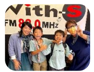
小学生の2人は準レギュラー(?!)