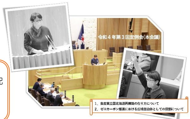
令和4年第3回定例会(本会議) 1. 食産業立国北海道再構築の在り方について 2. ゼロカーボン推進における広域自治体としての役割について