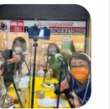
この日のテーマ『さっぼろ農業を応援しよう！』

東日本大震災の時にコミュニティFM(地域のラジオ放送局)が、地域に貢献した事例に注目してきました。4期目から、地元白石区、お隣の厚別区のラジオ局とご縁ができ、毎週それぞれ1時間の番組を担当してきました。小学生から、地元の企業・団体の代表の方など、さまざまな実践者の方に出演いただき、私自身が学ぶ過程を、みなさんにも情報「共有」しています。非常時のためにも、日常的にラジオを活用する機会を増やしていきたいです。