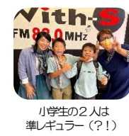
小学生の2人は準レギュラー(?!)

《白石区》エフエムしろいし《83.0MHz》 毎週月曜日 10:30～11:30 『広田まゆみのすっきりマンデー』放送中！！