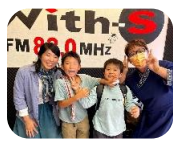
小学生の2人は 準レギュラー(?!)

東日本大震災の時にコミュニティFM（地域のラジオ放送局）が、地域に貢献した事例に注目してきました。4期目から、地元白石区、お隣の厚別区のラジオ局とご縁が でき、毎週それぞれ1時間の番組を担当してきました。