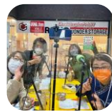
この日のテーマ『さっほろ農業 を応援しよう!!』