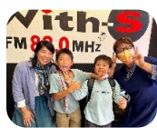
小学生の2人は 準レギュラー(?!)

東日本大震災の時にコミュニティFM（地域のラジオ放送局）が、地域に貢献した事例に注目してきました。4期目から、地元白石区、お隣の厚別区のラジオ局とご縁が でき、毎週それぞれ1時間の番組を担当してきました。