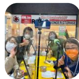
この日のテーマ『さっほろ農業を応援しよう!!』

小学生から、地元の企業・団体の代表の方など、さまざまな実践者の方に出演いただき、私自身が学ぶ過程を、みなさんにも情報「共有」しています。 非常時のためにも、日常的にラジオを活用する機会を増やしていきたいです。