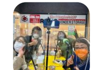
この日のテーマ『さっぽろ農業を応援しよう！』

東日本大震災の時にコミュニティFM(地域のラジオ放送局)が、地域に貢献した事例に注目してきました。4期目から、地元白石区、お隣の厚別区のラジオ局とご縁がで、毎週それぞれ1時間の番組を担当してきました。 小学生から、地元の企業・団体の代表の方など、さまざまな実践者の方に出演いただき、私自身が学ぶ過程を、みなさんにも情報「共有」しています。 非常時のためにも、日常的にラジオを活用する機会を増やしていきたいです。